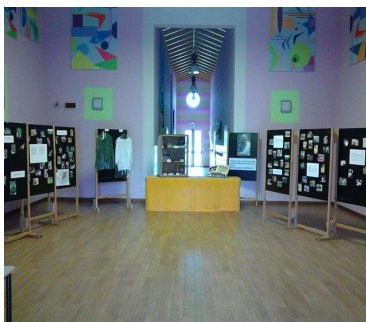
Mostra fotografica polo scolastico