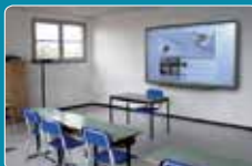
Aule Liceo con LIM