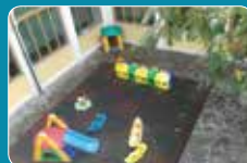
Secondo cortile interno