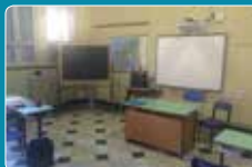
Aule Sec. I grado con LIM