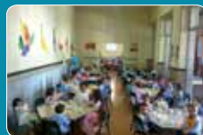
Sale da pranzo