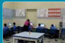
Lab. Informatica Primaria