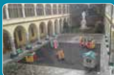
Primo cortile interno