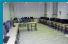
Lab. Informatica Secondaria