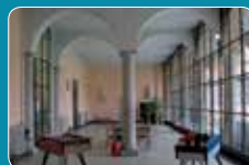
Veranda - Sala giochi